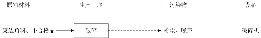
图 2-3 废边角料回收工艺流程及产污环节图

破碎： 项目产生的废边角料、不合格品经破碎机破碎后重新回用到投料工序。破碎在密闭破碎机进行，产生少量粉尘和噪声。