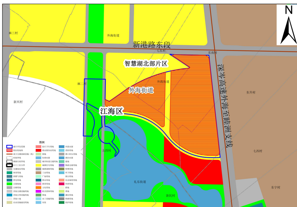
图3 江门市江海区 2025 年度土地征收成片开发范围（第一批）智慧湖北部片区位置图