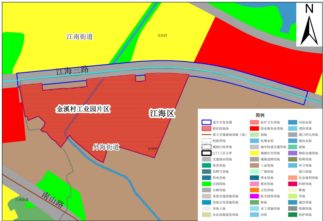
图 1 江门市江海区 2025 年度土地征收成片开发范围（第一批）金溪村工业园片区位置图