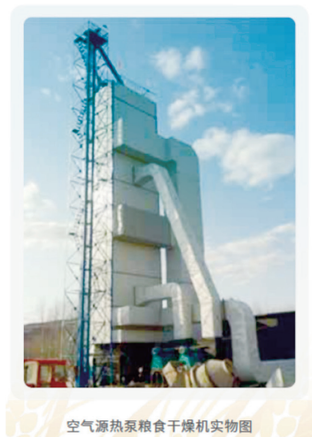
空气源热泵粮食干燥机实物图