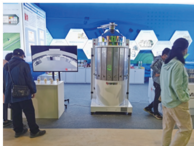
入选“国家‘十三五’科技创新成就展”

核心成果柔性碾米机，采用柔性砂带替代已一个半世纪的刚性碾米砂辊或铁辊，大米出品率可提升 5~8 个百分点以上。与传统碾米机相比，加工籼米时碎米率下降 6 个百分点以上(粳米碎米率下降 3 个百分点以上)，吨米电耗下降 10kW·h，糙米加工成白米时米粒温度上升幅度下降 15°C 以上，调整参数还可生产留胚米。技术评价结论“达到国际领先水平”。