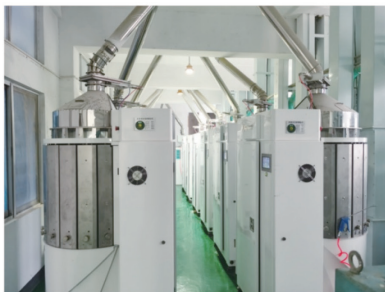
大米车间应用现场之一