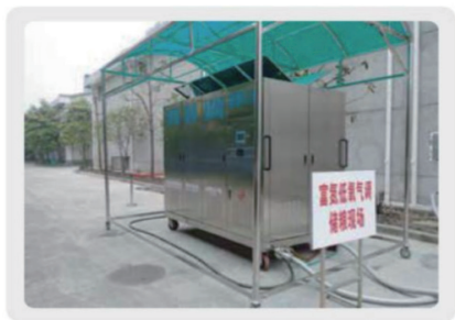
膜分离氮气循环气调储粮现场图