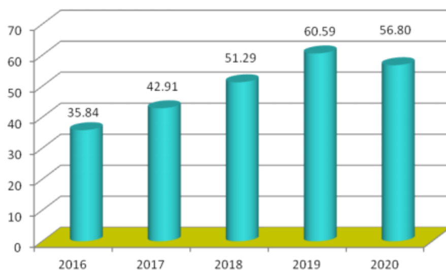
图2 “十三五”时期高新区社会消费品零售总额（亿元）

通过加大对零售商超、二手车交易市场、拍卖典当行、网店、直销行业和“工厂+互联网”的销售管理，加大对汽车销售和油品的促销力度，推进工业企业产销分离，做好商贸企业“小升规”工作，扩大入统企业种类，千方百计保障社会消费品零售总额稳步增长。2016-2020 年全区实现社会消费品零售总额分别为 35.84 亿元、42.91 亿元、51.29 亿元、60.59 亿元和 56.80 亿元，年均增速达 5.6%。