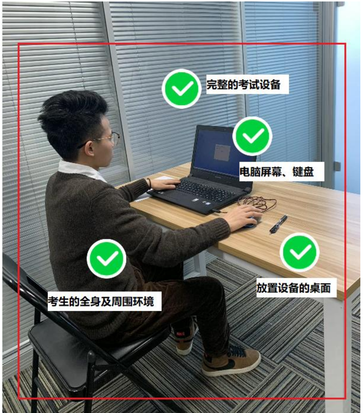
图二：佐证视频监控视角