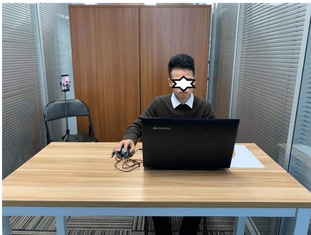
图一：笔试电脑端正面视角/面试电脑端备课正面视角

同时应在考试坐位的后侧面设置合适的放置移动设备（手机或平板）的位置，保证移动设备能够从后侧面拍摄到考生桌面、笔记本电脑屏幕、周围环境及考生考试全过程。