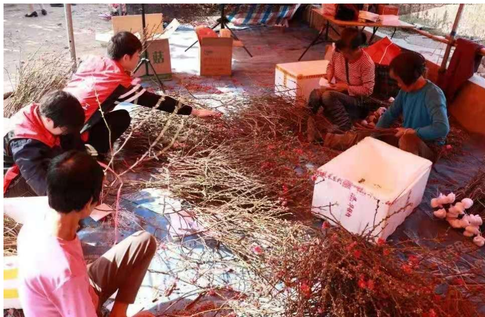
图：农户和志愿者忙着对桃花枝进行分装打包