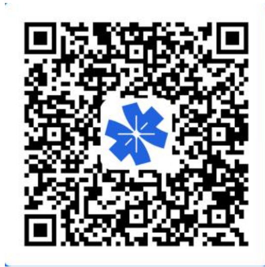
江海区政务服务数据管理局专属二维码