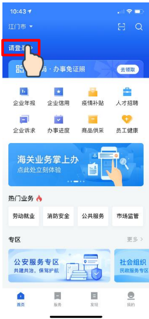
① 点击 [请登录]

在“粤商通”APP首页，点击 [请登录] - [人脸识别登录]，输入身份信息，打开微信“粤信签”小程序，完成人脸识别验证，再返回“粤商通”APP