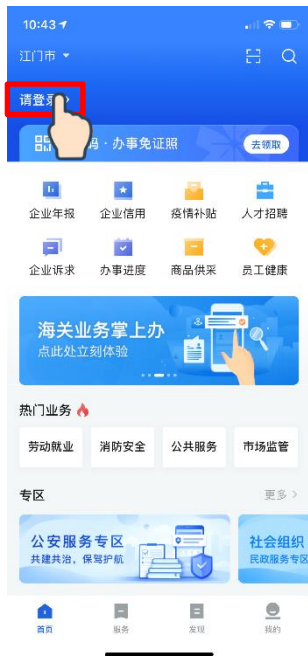
① 点击 [请登录]

在“粤商通”APP首页，点击 [请登录] - [人脸识别登录] ，打开微信“粤信签”小程序，输入身份信息，完成人脸识别验证，再返回“粤商通”APP