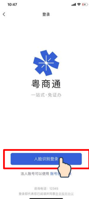
② 点击 [人脸识别登录]