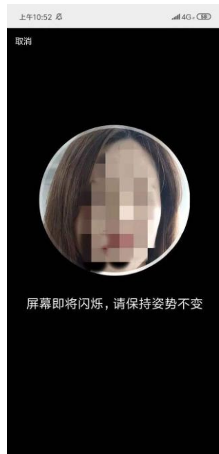
⑤ 完成人脸识别验证