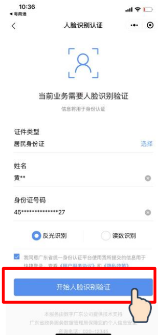
③ 打开“粤信签”小程序 输入身份信息