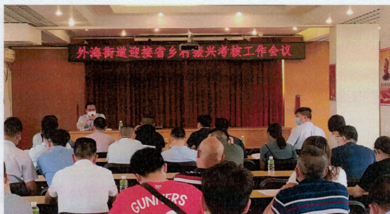
图为区委农办业务骨干到外海街道对镇村基层干部、派驻第一书记授课

五是用好一支队伍。 充分借鉴新冠肺炎疫情防控“网格化”的工作机制，用好用活 18 名网格员，每人负责 2 个行政村，对 36 个行政村实施循环式的督查督导，加大日常检查力度，及时发现问题，督促各行政村迅速及时整改，利用微信群晒整治前后对比后果图的方式，形成比学赶超的良好氛围。