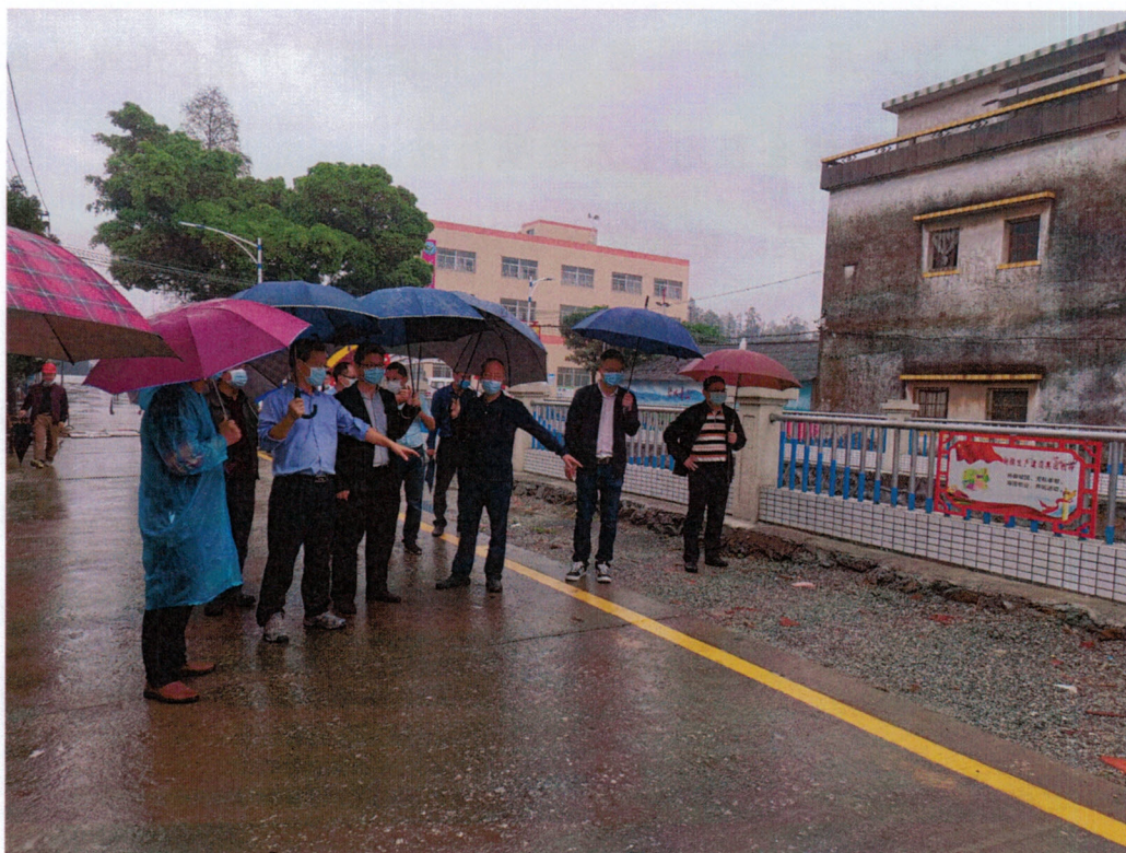
图为 3 月 19 日区领导冒雨调研疫情防控和城乡环境综合整治工作

三是推进一项行动。 深入贯彻落实全市农村人居环境专项整治“三治理两提升”工作要求，以礼乐街道为试点，以点带面推动农田（含菜地、果林、鱼塘等）管理管护房整治提升，实现“干净整洁、美化绿化、示范带动”目标。以专项整治为契机，研究制定《江海区农田管理看护房专项整治工作方案》，探索建立农田管护房长效管理机制。经摸底，目前共需要整治的农田生产用房共 601 家，下一步结合农田管护房的类别性质按照拆除清理、美化提升两种方式处理。