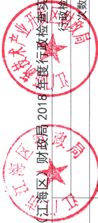
江门高新区（江海区）财政局 2018 年度行政检查实施情况统计表